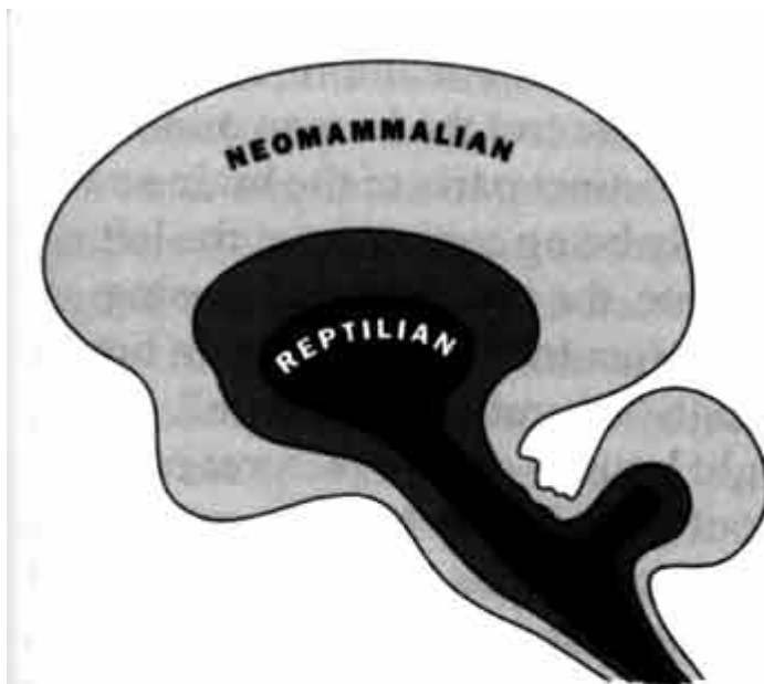
Figure 46: The reptilian brain or "R-complex" is an ancient part of the human brain. From here we get the character traits of cold-blooded behaviour, the desire for top-down hierarchy, and an obsession with ritual. These are balanced by other parts of the brain in humans, but not in the full-blown reptilians, which manipulate this planet

Obr. 46: Gadzi mózg (r-kompleks) jest starodawną częścią ludzkiego mózgu. Stąd uzyskujemy nasze cechy charakterystyczne, np. zimno-krewnego zachowywania, pragnienia po hierarchii z góry w dół, i obsesje na punkcie obrządków. Te są równoważone przez inne części mózgu ludzkiego, ale nie w gadzim mózgu.