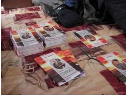
Livres de la Doctrine du Message pour les Ministres