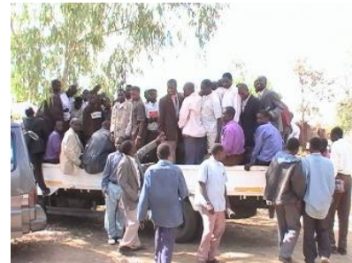
42 pasteurs et 17 autres personnes ont voyagés 1500 Kilomètres de Mozambique à Malawi sur le dos de ce camion