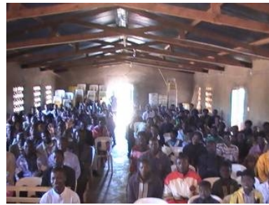
Nous avons dit notre au revoir aux ministres du Malawi et du Mozambique et à quelques croyants locaux

que dans Actes 8, la confession finale de l'eunuque Éthiopien était que " je crois que Jésus est le Fils de Dieu " et que sur cette confession il a donc désiré être baptisé. Un défi a ensuite été lancé aux gens de croire la Parole du Seigneur et pour ceux qui n'étaient pas en Christ, de se repentir et de venir devant pour le baptême. Plusieurs personnes sont venus devant pour la repentance et le baptême dans le nom du " Seigneur Jésus-Christ " et beaucoup plus encore sont venu pour prière.