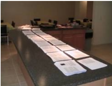
Livres de la Doctrine du Message pour les Ministres