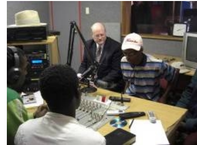
Ministère de radio au centre communautaire