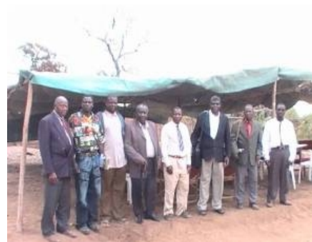
Beaucoup de pasteurs ayant des églises au Malawi et Mozambique, déjeuner aux réunions de Balaka , Malawi

Ensuite, après les huit points, Fr Brian a continué à enseigner 16 points soutenu par les Saintes Ecritures, qui détaillent la différence entre le Père et le Fils. C'était comme suit: