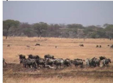
Troupeaux de gnous et zèbres dans le Serengeti

Nombre de jeux des livres de la Doctrine du Message distribués (Portugais) = 100