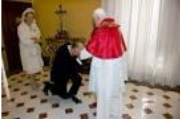
Premierminister Tony Blair verneigt sich vor dem Papst.