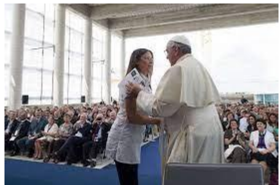
Der Papst in einer Pfingstler Kirche

Warum sind wir keine Konfession? 58-0927 P:45 Ich habe oft gehört, dass über dem Thron des Papstes von Rom geschrieben steht: "Vicarius Filii Dei." Ich habe mich oft gefragt, ob das wahr ist. Zeichne eine Linie und zeichne sie in Zahlen in römischen Ziffern und sieh, ob sie es ist. Es ist genau die Wahrheit. Ich stand so nah an der dreifachen Krone des Papstes in einem Glas: Gerichtsbarkeit der Hölle, des Himmels und des Fegefeuers (Purgatorium). Seht ihr? Also, diese Dinge, ich bin gerade von dort gekommen, gerade von Rom gekommen und weiß, dass es die Wahrheit ist. Jetzt wissen wir, dass es abgebildet ist. Und hier die sieben Könige: fünf sind gefallen... (was damals zu der Zeit war), ... und einer ist... (Das ist der, der jetzt kommt, und das war Cäsar.)... und ein weiterer muss noch kommen... (das war Niro, der böse war);... Nun beobachte, sieh zu, wie perfekt es ist... und wenn er kommt, muss er eine kurze Zeit weitermachen. Weiß jemand, wie lange Niro regiert hat? Sechs Monate. Er zog seine Mutter auf einem einzigen Baum von einem Pferd durch die Straße und brannte die Stadt nieder und legte es auf die Christen und fiedelte auf dem Hügel, während sie die Stadt niederbrannten. Sechs - sechs Monate. Und seht ihr: "Und das Tier..." Nun beobachte, schau, was für ein Schlingel er war!