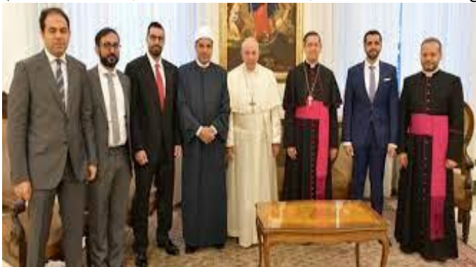
Wenn Sie etwas Auffälliges sehen wollen, Papst mit muslimischen Führern

(Kein Wunder, dass sie sie hassen, weil sie ihnen sagt, was sie tun sollen, weil sie das Gold hat.)