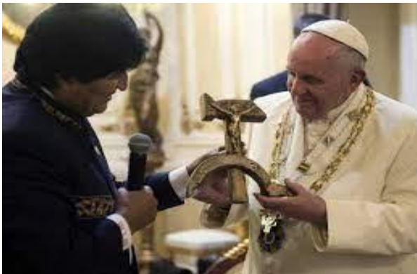
Der Papst mit einen Kommunist

13 Diese haben einen einmütigen Sinn, und sie übergeben ihre Macht und Herrschaft dem Tier. 14 Diese werden mit dem Lamm Krieg führen , und das Lamm wird sie besiegen — denn es ist der Herr der Herren und der König der Könige —, und mit ihm sind die Berufenen, Auserwählten und Gläubigen. 15 Und er sprach zu mir: Die Wasser, die du gesehen hast, wo die Hure sitzt, sind Völker und Scharen und Nationen und Sprachen.