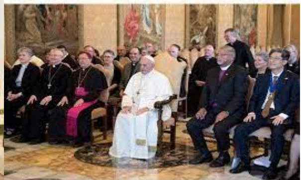
Papst mit methodistischen Führern

Warum sind wir keine Konfession? 58-0927 P:49 Lass uns sehen. Und das Tier, das war und nicht ist, ... (die 11. Vers)... und doch ist der achte, jetzt der siebente, und geht ins Verderben. (Er wird weiter machen, bis er die bodenlosen Grube am Ende des Wege erreicht.) Und die zehn Hörner, die du gesehen hast, sind zehn Könige, ... sind zehn Könige, welche haben noch kein Königreich empfangen, sondern Macht empfangen als Könige eine Stunde mit dem Tier. Sie sind keine gekrönten Könige, sie sind Diktatoren. Seht ihr, sie sind nie zum König gekrönt worden, sondern sie haben eine Stunde in der Regierung des Tieres Macht als Könige empfangen. Das ist gerade in dieser