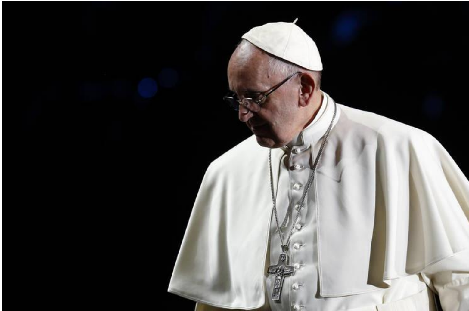
Pave Frans deltar på et økumenisk arrangement på Malmö Arena i Malmö, Sverige, 31. oktober.